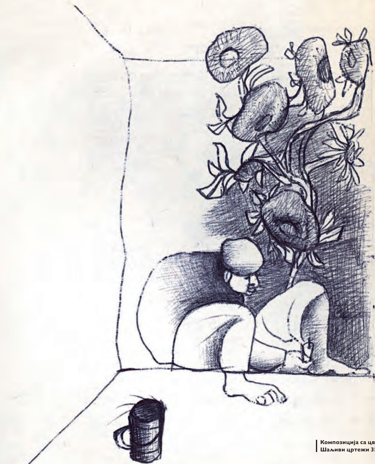
Композиција са цвећем и фигуром Шаљиви цртежи 356 (деталј око 1972)