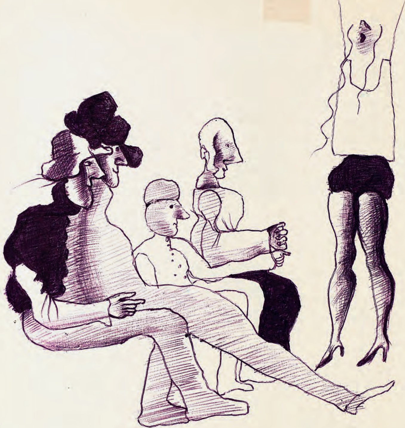
Певачица и публика Шаливи цртежи 15 (око 1970)