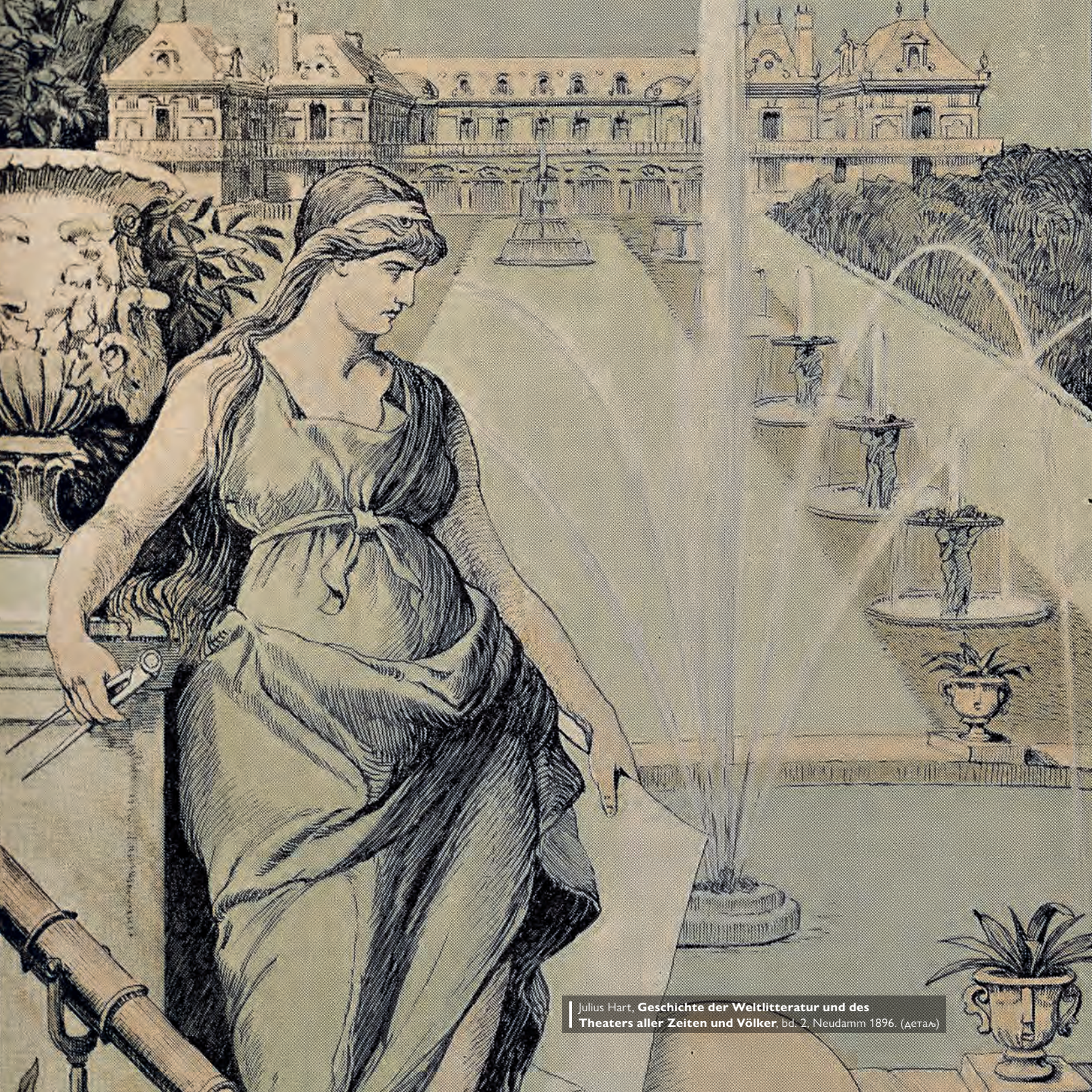
Julius Hart, Geschichte der Weltliteratur und des Theaters aller Zeiten und Völker , bd. 2, Neudamm 1896. (деталь)