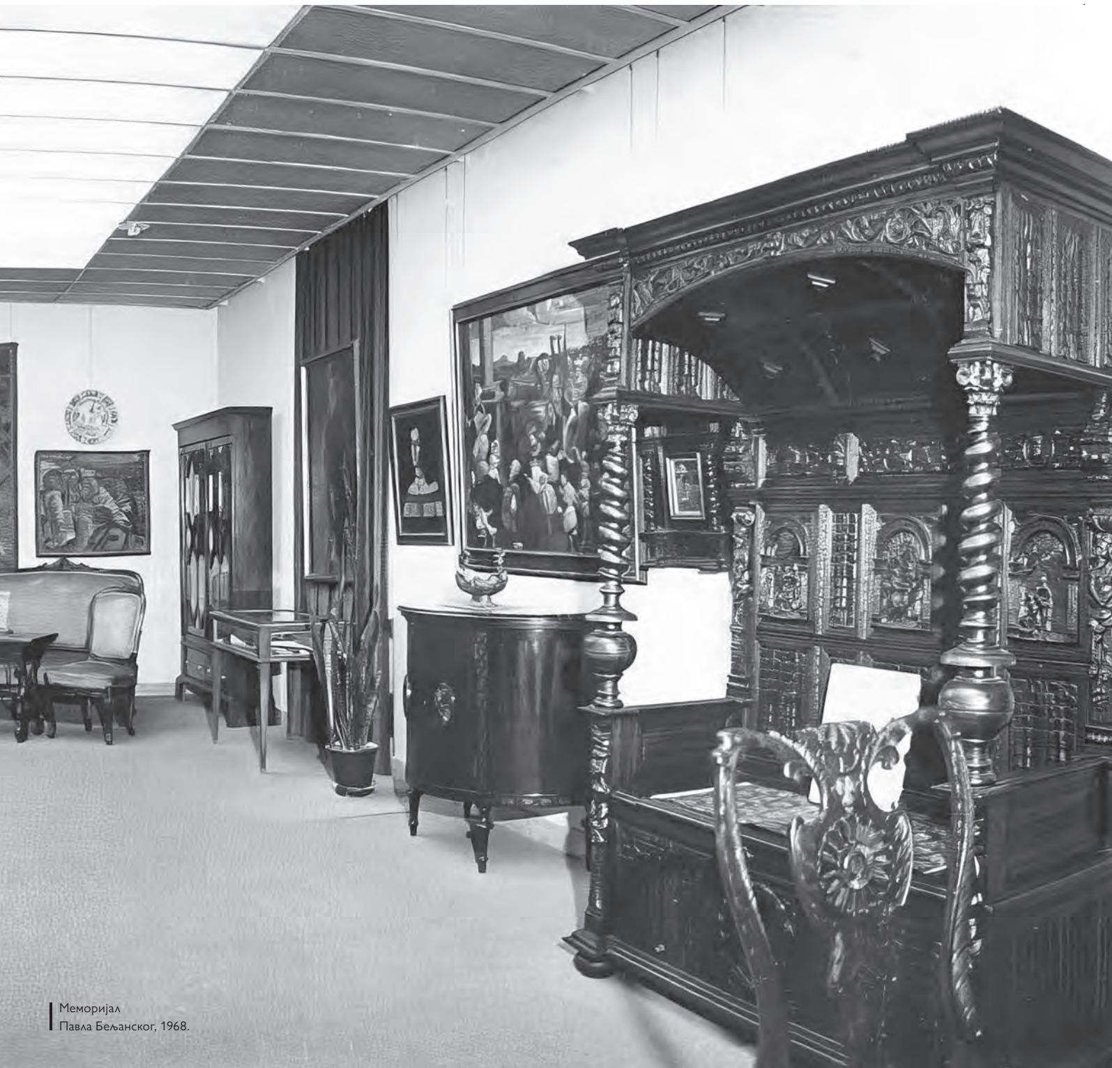
Меморијал Павла Бељанског, 1968.