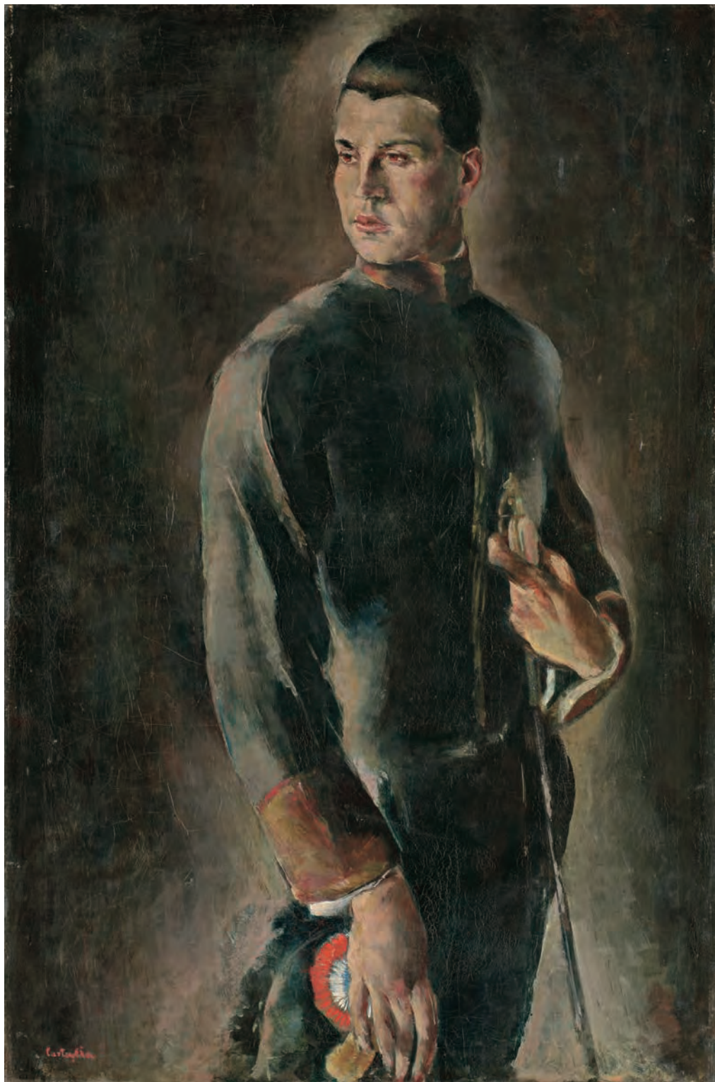
Марино Тартаља Млади дипломата (1923) Спомен-збирка Павла Бељанског