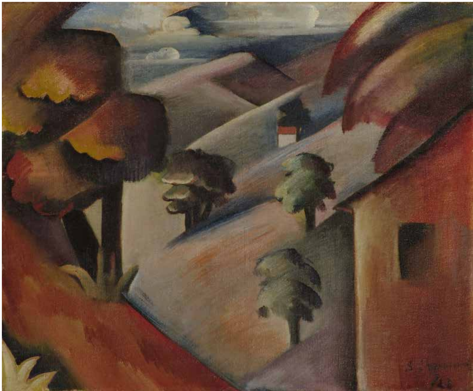
У планини (1920), Музеј савремене уметности, Београд Dans la montagne (1920), Musée d'art contemporain de Belgrade