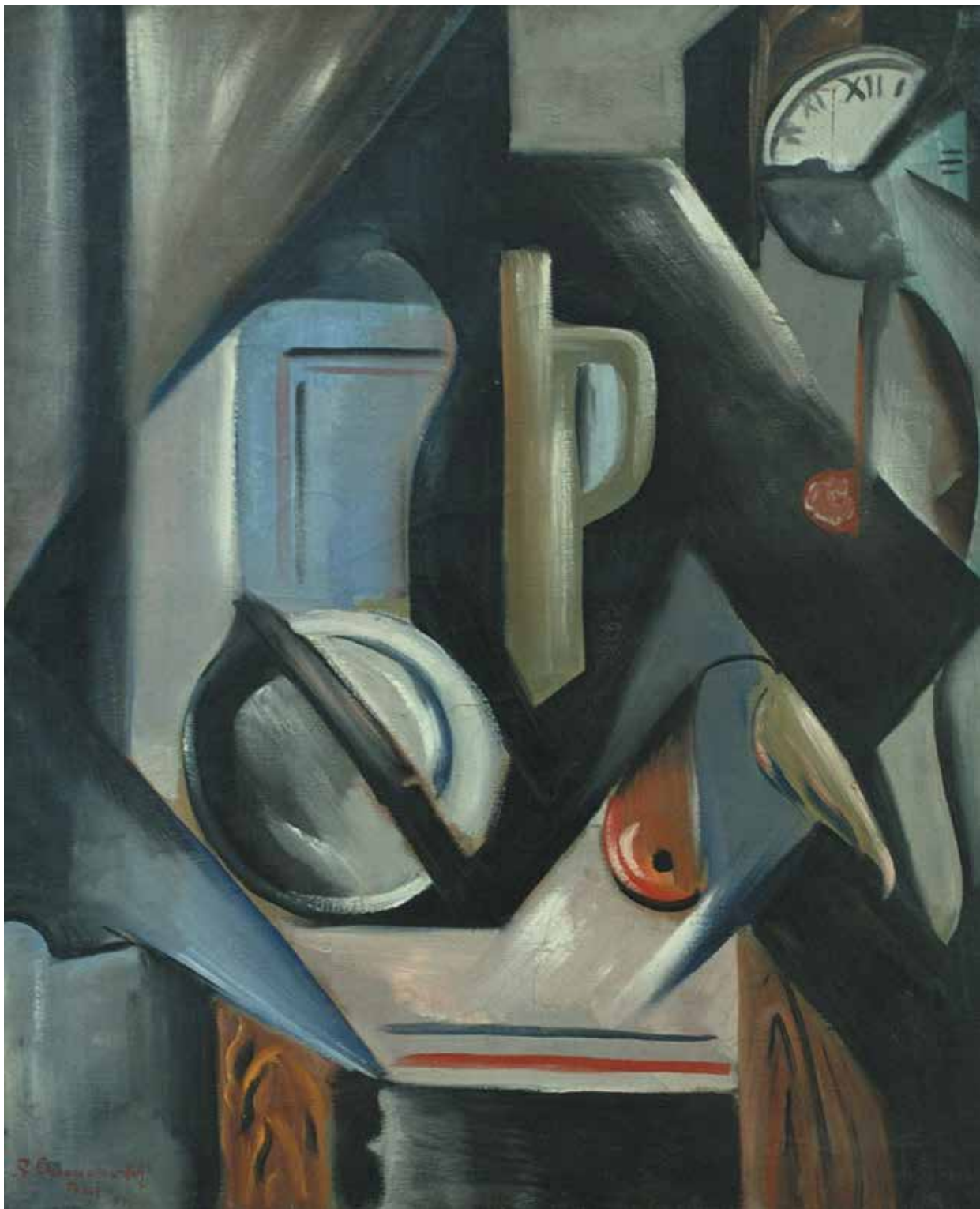
Композиција са сатом (1921), Музеј савремене уметности, Београд La Composition avec la Montre (1921), Musée d'art contemporain de Belgrade