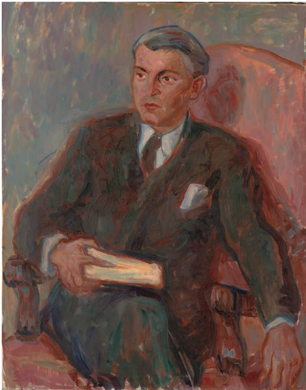
Зора Петровић Портрет Павла Бељанског (1943)