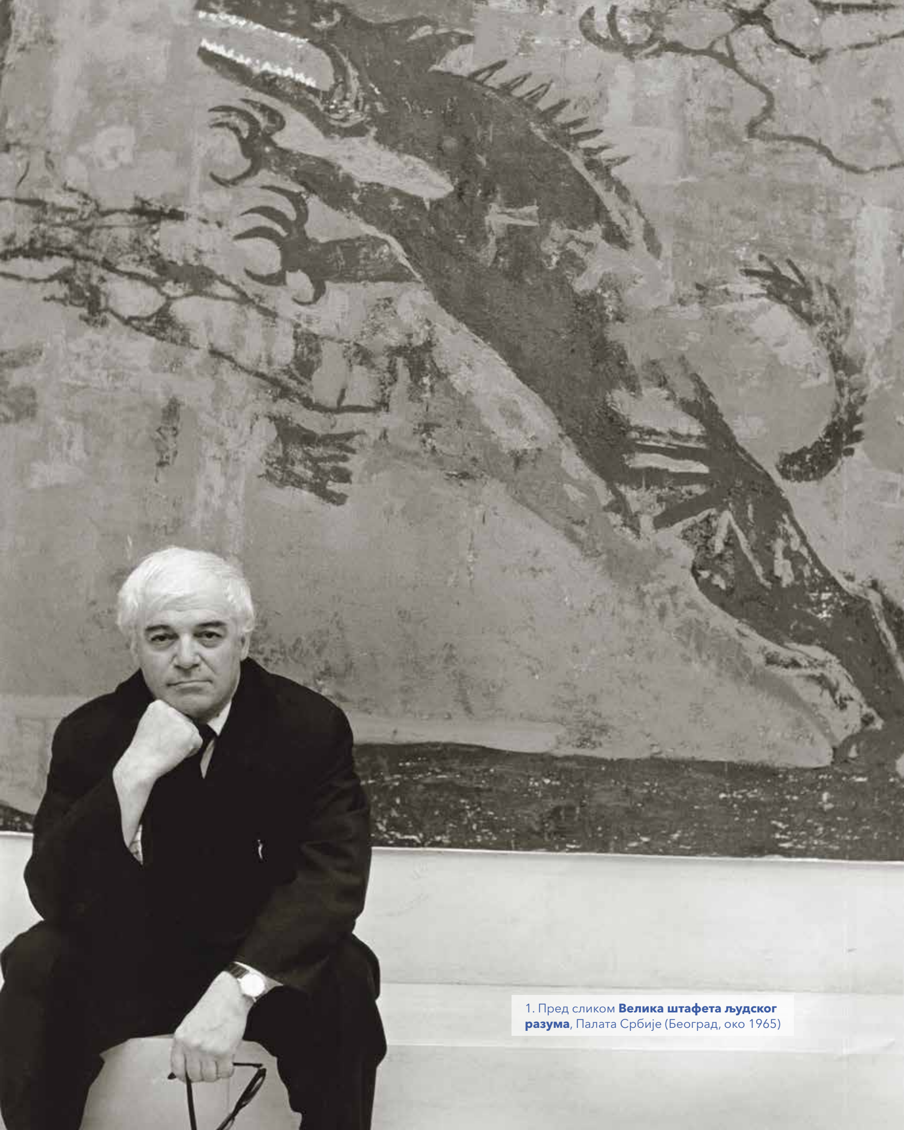
1. Пред сликом Велика штафета људског разума , Палата Србије (Београд, око 1965)