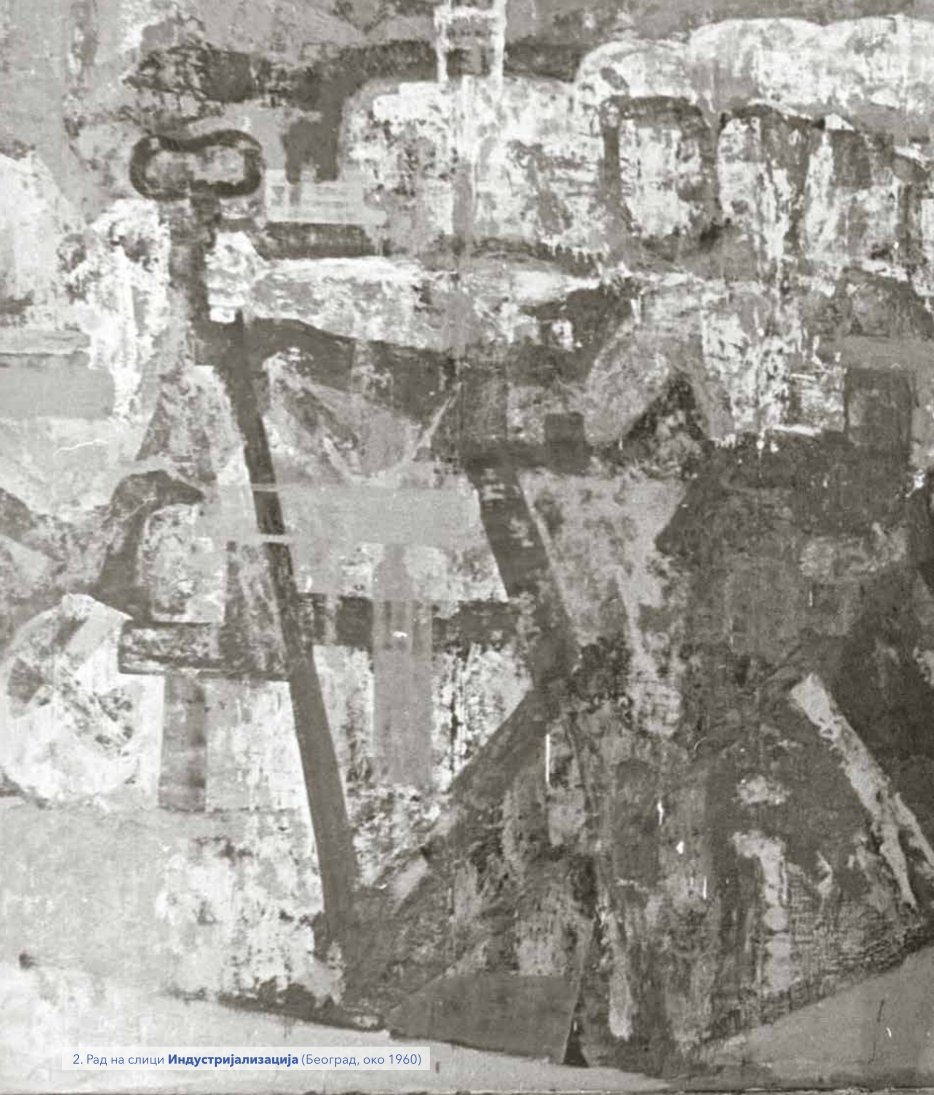
2. Рад на слици Индустијализација (Београд, око 1960)