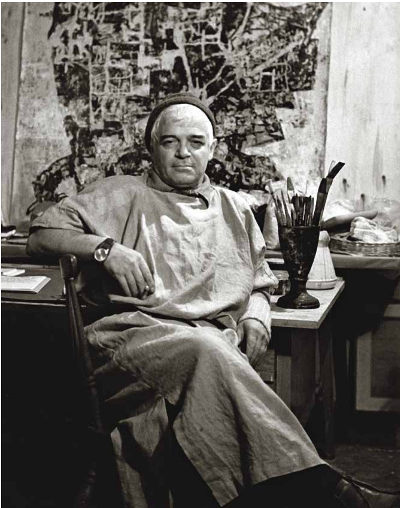
3. У атељеу (Београд, 1967)