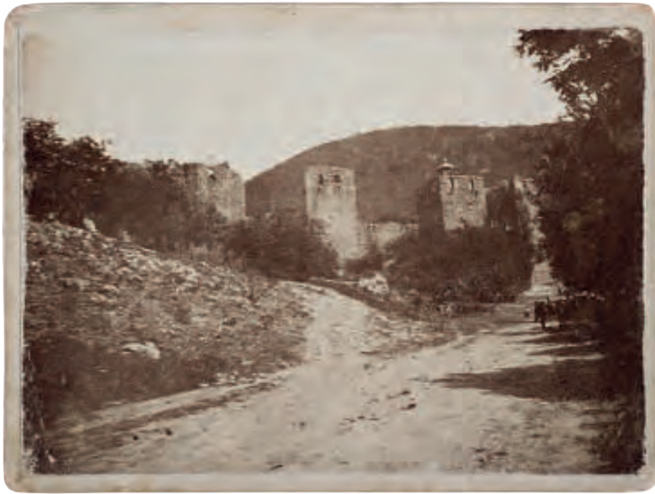
Павле Бељански Манастир Манасија , 1907. (кат. бр. 29)

одеће и позадине до осветљења и композиције, и носио је одређену поруку, откривајући нешто о вредностима и тежњама оних који су се нашли пред објективом. Кроз Збирку можемо да пратимо и процесе усавршавања техничких могућности фотокамере и развој њене употребе у свакодневици грађанских породица, те касније њену важност у медијској комуникацији, првенствено кроз новинску фотографију после Другог светског рата.