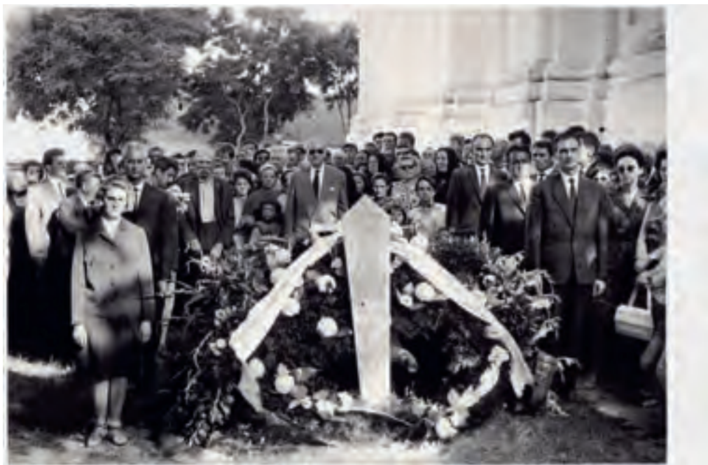
Љубиша Савић Сахрана Павла Бељанског, последња почасна стража (II) Госпођинци, 1965. (кат. бр. 245)

ди породичну гробницу у порти цркве у Госпођинцима, те да у њу сахрани своје претке који су ту већ почивали, да у њу пренесе земне остатке оца, мајке и брата, а када дође време да и он сам ту буде сахрањен. Након динамичних преговора, 1964. године започеле су припреме за изградњу гробнице, о чему сведоче и сачуване фотографије. Гробница је била завршена до тренутка када је Павле Бељански изненада преминуо у Београду, 14. јула 1965. године.