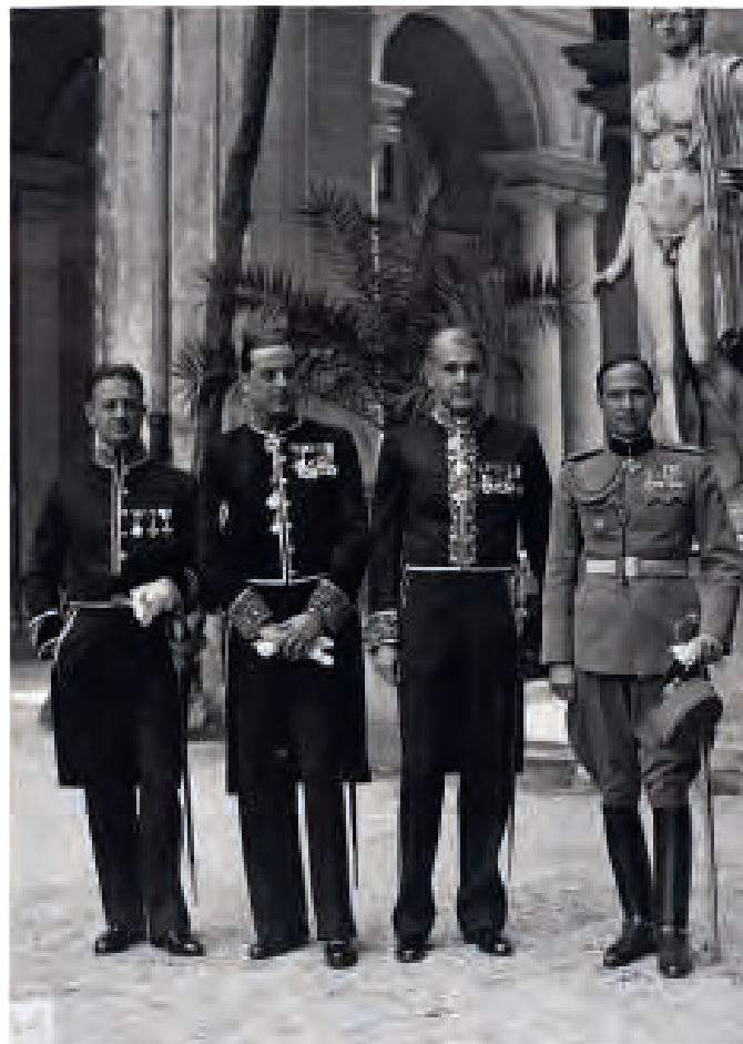
Особље југословенских посланстава у Италији и при Светој Столици Рим, 1938. (кат. бр. 129)